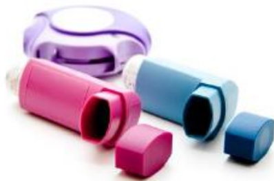
Device : MDI, ACCUHALER