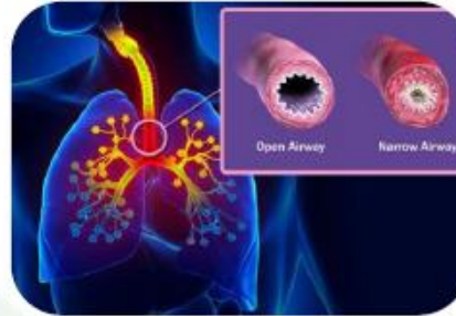
Disease Education Card