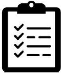
APPENDIX 1, 2,3