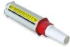
PEAK FLOW Meter